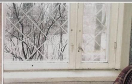
Уберите с окон горшки с цветами и поставьте их на пол