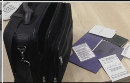
На случай эвакуации сложите в сумку наиболее важные документы, вещи