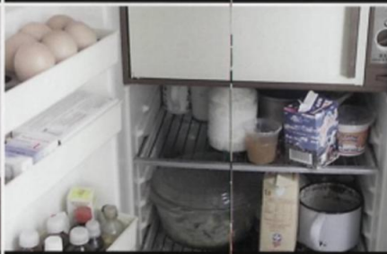
Задерните шторы, приготовьте запас воды и питания