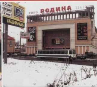
В зрелищных учреждениях