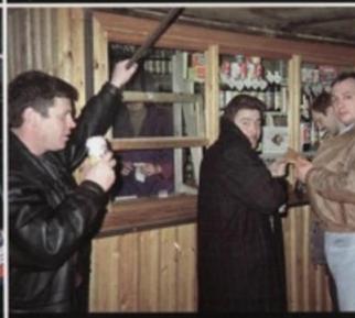
Возле торговой палатки