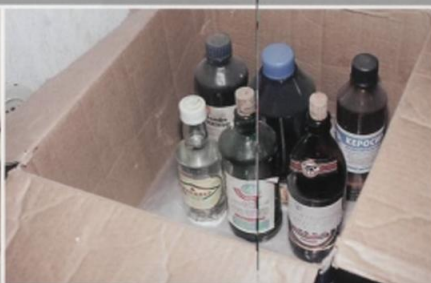
Уберите в безопасное место пожароопасные материалы: краску, бензин, газ в баллонах