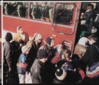
В общественном транспорте