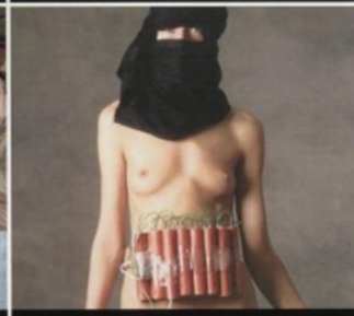
На теле смертника