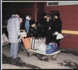
На вокзале, в метро