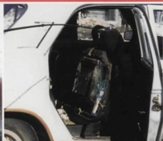
В припаркованной машине