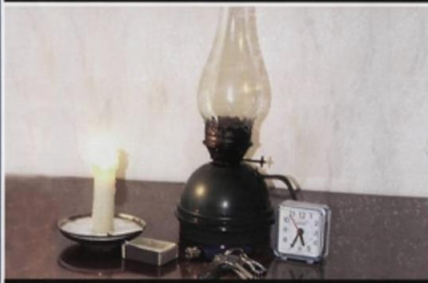
Подготовьте аварийные источники освещения