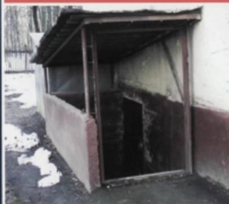
В подвале жилого дома